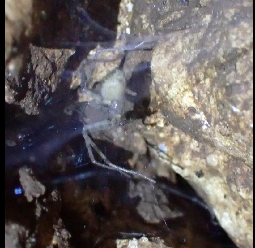
Tégénaire (immature ?)