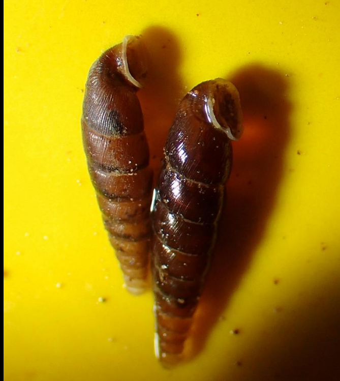
Sommet de la coquille tronqué