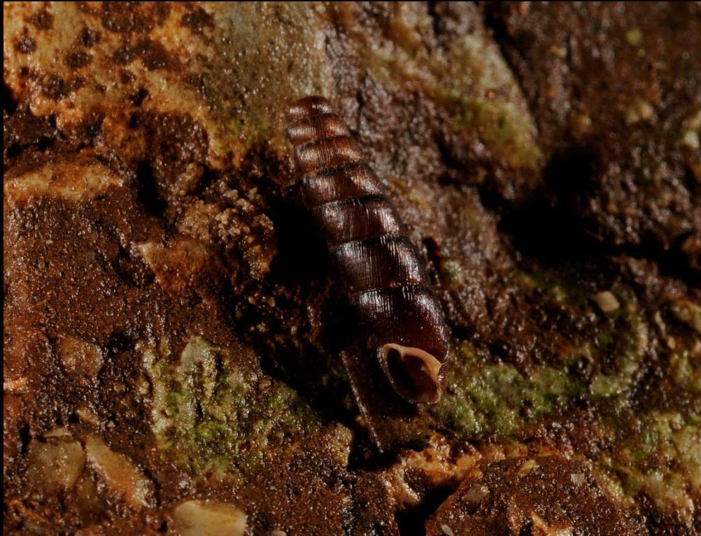
Sommet de la coquille arrondi