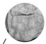
Dessin naturel de bison sur la roche